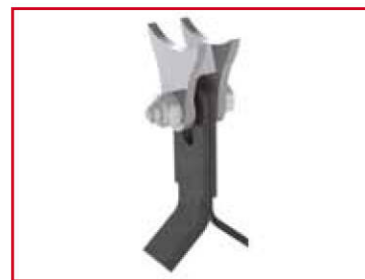
Fléau Y de 30 x 5 mm