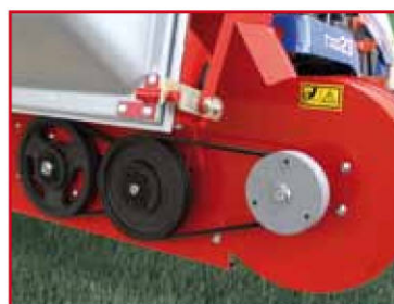
Transmission avec embrayage centrifuge