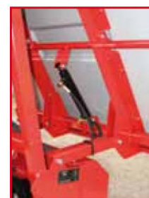
Vidange hydraulique (en option pour TURBO 530 LD)