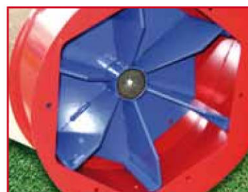
Turbine Ø 400 mm avec 6 pales