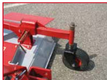
Roue pneumatique Ø 230 x 80