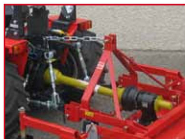
Attelage universel pendulaire