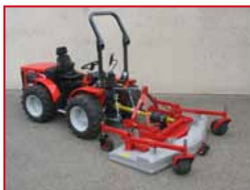
Montage sur CARRARO à poste inversé