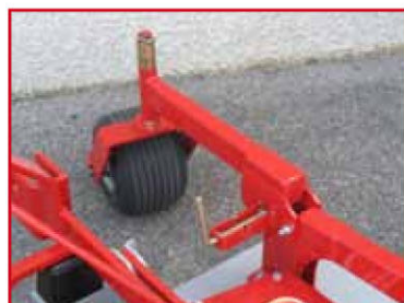
Roue pneumatique Ø 260 x 175