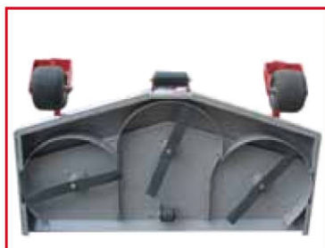
Plateau de coupe TX 1800EA, 3 lames